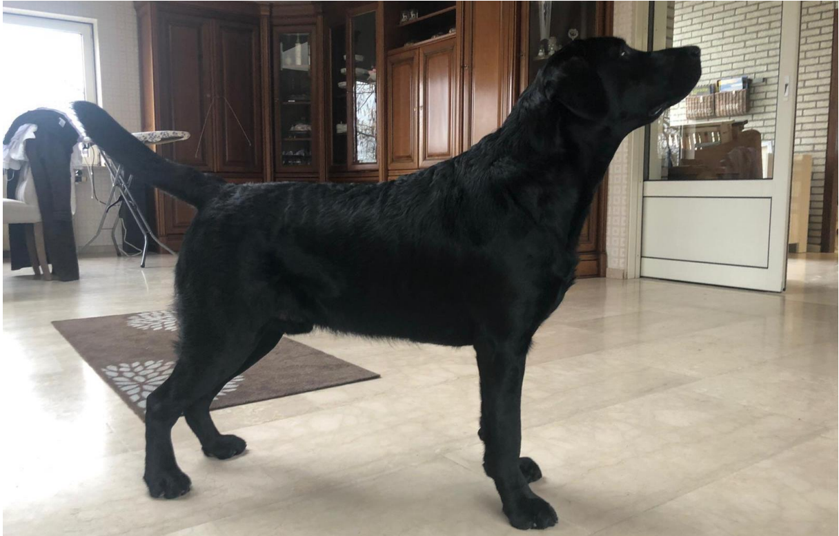
Lewis bijna 1 jaar- februari 2020